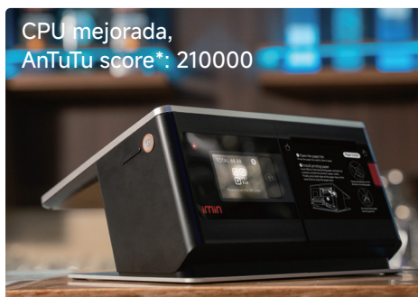
CPU mejorada, AnTuTu score*: 210000