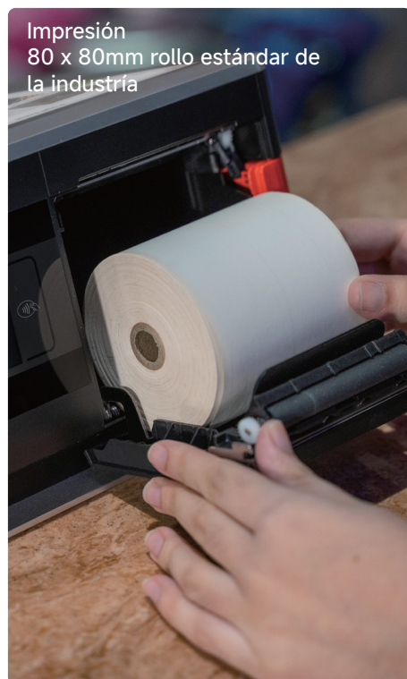
Impresión 80 x 80mm rollo estándar de la industria