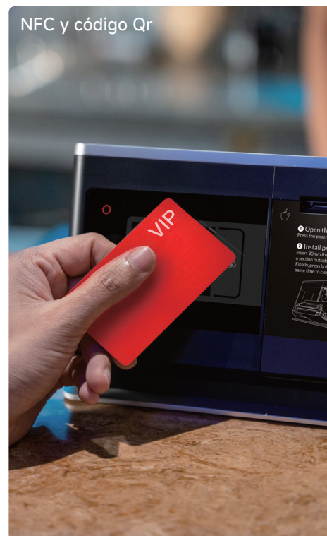
NFC y código Qr